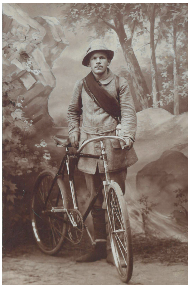
Рис. 2. Б. П. Марковский гимназист

Великая Отечественная война застала Бориса Павловича на Урале, куда он выехал на полевые работы. В начале войны он был прикомандирован в качестве консультанта к Уральскому геологическому управлению и продолжал изучение девонских отложений в связи с их бокситоносностью. Проживал Борис Павлович в это время в поселке