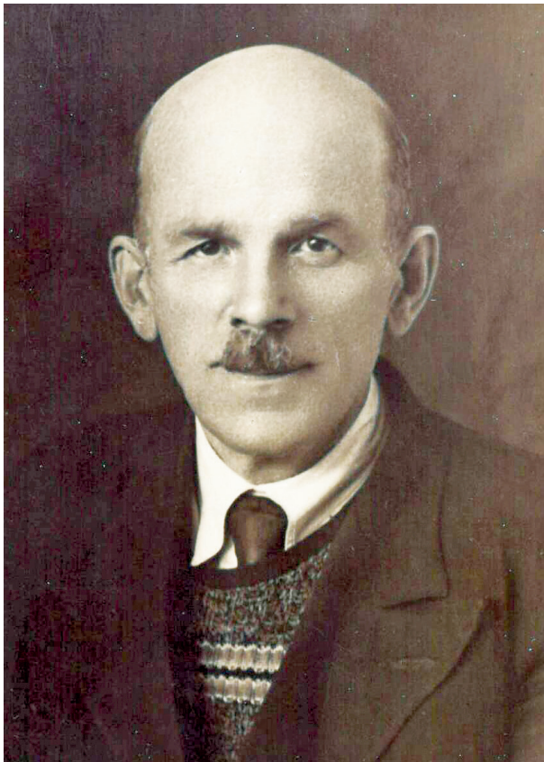
Рис. 1. Б. П. Марковский (1895–1966)

В мае 2025 г. исполнилось 130 лет со дня рождения Бориса Павловича Марковского — выдающегося представителя стратиграфо-палеонтологической школы Всесоюзного научно-исследовательского геологического института (далее — ВСЕГЕИ) (рис. 1). Его коллега А. И. Жамойда называл его «ходячей