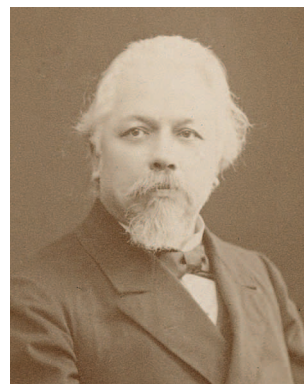
Директор Геолкома с 1885 г. Александр Петрович Карпинский